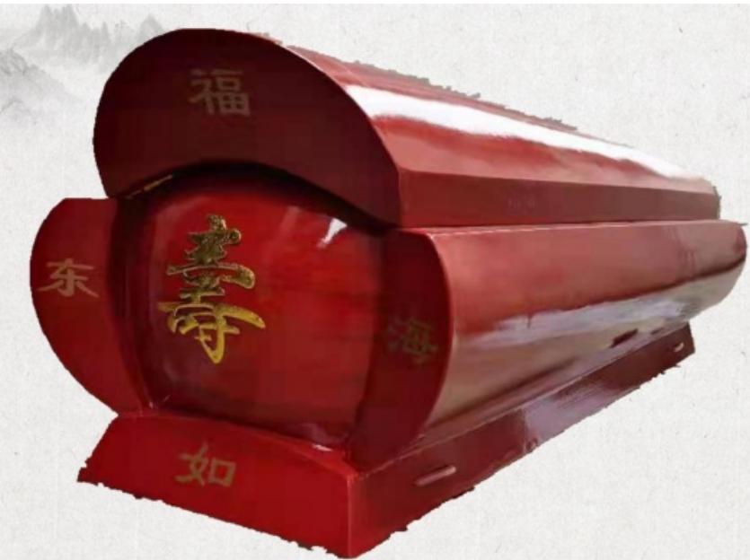
4、中式豪华福寿环保火化棺：