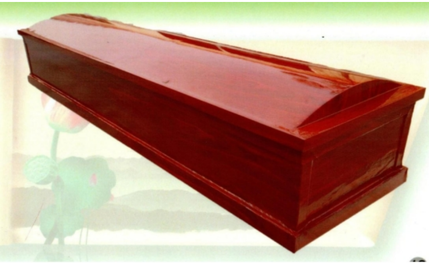
7、西式普通环保火化棺：