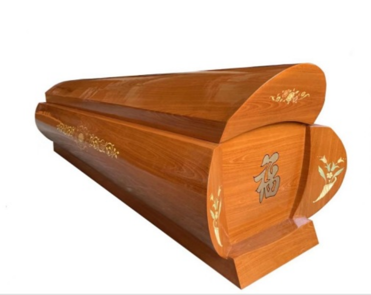
3、中式龙凤环保火化棺：