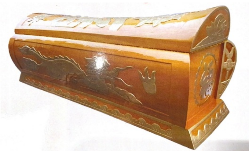
6、西式纸花环保火化棺：