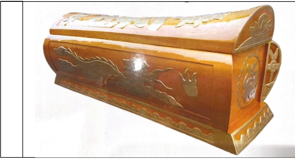
6、西式纸花环保火化棺：