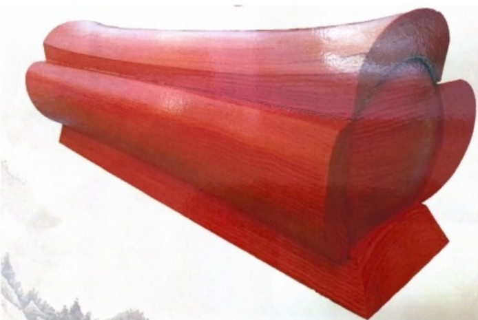
5、中式豪华龙凤环保火化棺