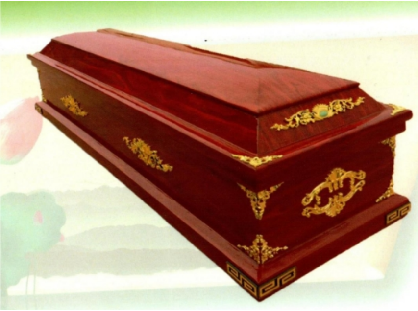
9、西式特大环保火化棺：